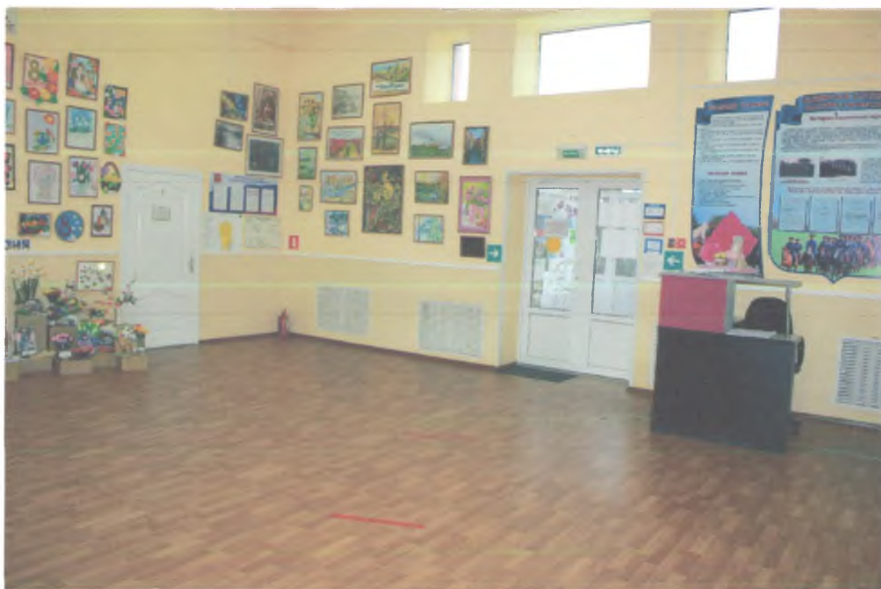
Фото № 11