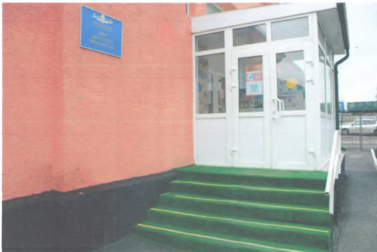
Фото № 8